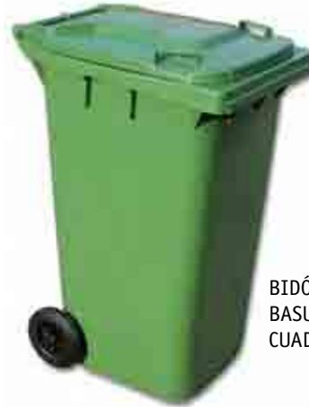
BIDÓN BASURA CUADRADO