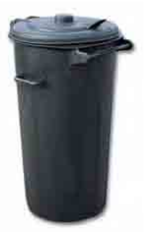
BIDÓN BASURA NEGRO